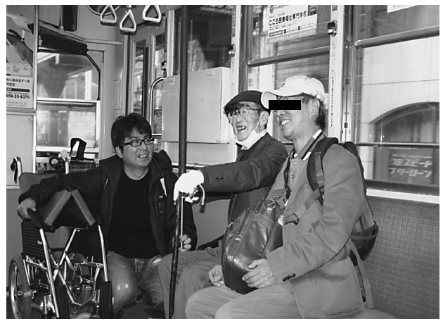
写真1 息子と観光地に向かう（電車内）